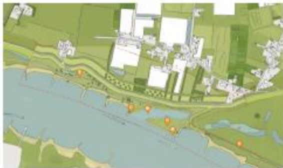
Afbeelding 1. Alternatief 1: beperkte verlegging