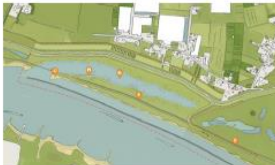
Afbeelding 2. Alternatief 2: natuurverbinding