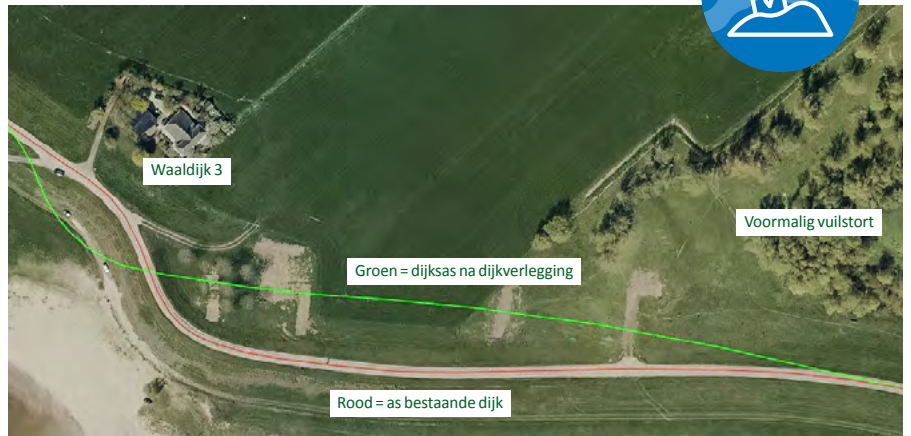
De dijkverlegging in beeld (groen is nieuwe as-lijn van de dijk)

Bij het verleggen kunnen we ook een stukje geschiedenis blootleggen. We maken namelijk eerst een dwarsdoorsnede van de dijk. Zo zijn er verschillende historische lagen te zien. Daarna kunnen we de oude dijk helemaal afgraven.