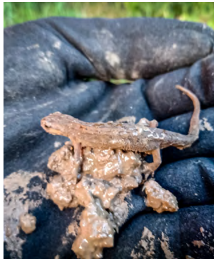
Om te voorkomen dat kamsalamanders en poelkikkers bij het werk komen, hebben we amfibie-schermen geplaatst. De gevangen dieren worden overgezet naar een veilige plek.