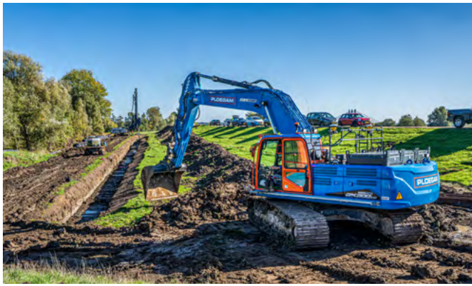
Twee elektrische kranen helpen mee de stikstofuitstoot terug te brengen. Daarnaast heeft het project ongeveer 2 miljoen euro subsidie ontvangen voor nog eens drie hydraulische graafmachines en twee elektrische tractoren.