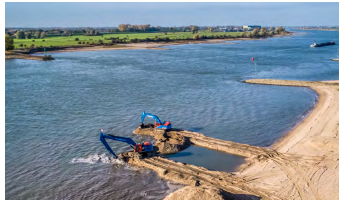
Aanleg van een loslocatie in cluster G 'Wolferen' (zie kaartje onderaan deze pagina). Hier voeren we grondstoffen aan via het water.