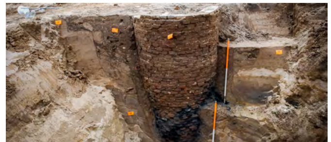
Resten van palen, waterputten en afvalkuilen van de historische boerderij Over d'n Dylick, gesloopt rond 1996.