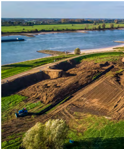
Het aanbrengen van de kunststof damwanden verloopt volgens plan. Links de machine die het tracé van de damwand voorboort.