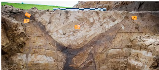
Waterputten. Hiervan zijn alleen de afdrukken van de houten palen en tonnen in de bodem terug te vinden.