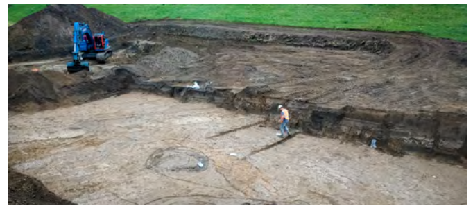
Verdedigingslijnen rond een wachttoren uit de Tachtigjarige oorlog (1568-1648). Een loopgraaf en greppels en mogelijk een toegangspoort.