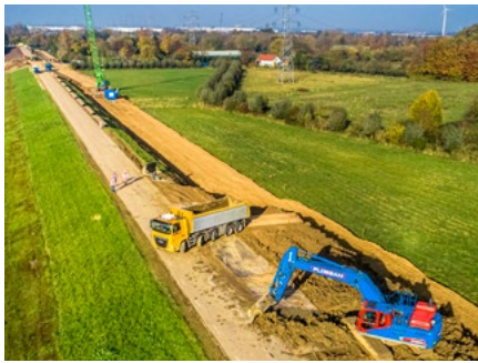
Klei aanbrengen aan de binnenzijde van de dijk bij Buitenplaats Oosterhout