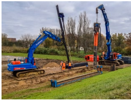
Damwanden bij bebouwbare dijk