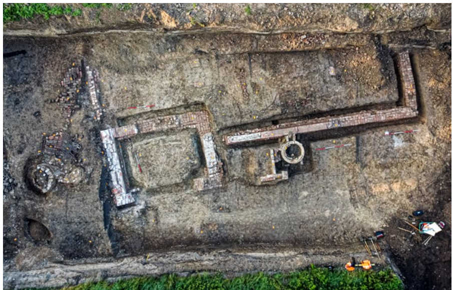
Resten van de T-boerderij bij Oosterhout, gezien vanuit de lucht