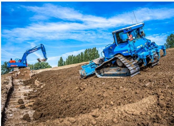
Klei aanbrengen aan de rivierzijde van de dijk bij Park Tergouw

Hoewel de damwanden aan de binnenkant van de dijk erin zitten, is daar nog wel werk aan de winkel. Daar moeten nog een deel van de verankering en de kleibekleding worden aangebracht. Tussen de Dorpsstraat en Oude Groenestraat zit nog voor de kerst de fundering van het nieuwe wegdek erin en ligt het asfalt erop.