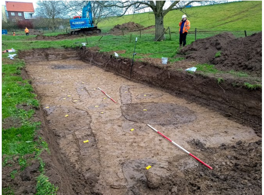
Kijkgat met resten uit de Romeinse tijd (de grijze en bruine verkleuringen) bij Oosterhout

De vondsten van het kanaal en de snelweg uit de Romeinse tijd waren zo bijzonder dat ze zelfs het landelijke nieuws haalden. Minder bekend zijn een bakstenen gebouw (een zogenaamde T-boerderij) uit de achttiende eeuw, verschillende schuttersputjes en een loopgraaf uit de Tweede Wereldoorlog. Heel fraai ook zijn de gevonden resten uit de zestiende en zeventiende eeuw bij Lent. Het gaat om bakstenen, luxe aardewerk en zilveren munten. De archeologen vermoeden dat hier een grote bakstenen herenboerderij heeft gestaan.