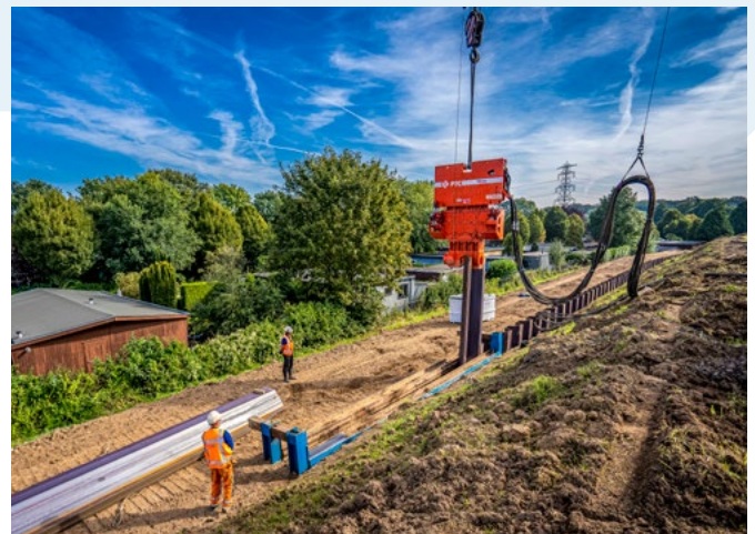
Plaatsen van damwanden bij Park Tergouw