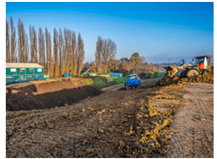
De bouwkeet van de aannemer in Oosterhout met uitzicht op de werkzaamheden